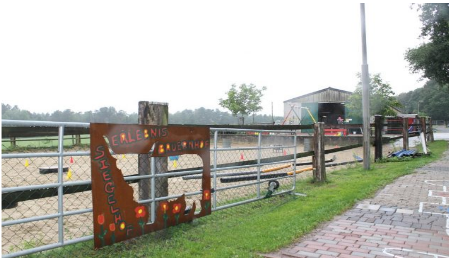
Der Siegelhof in Eynatten